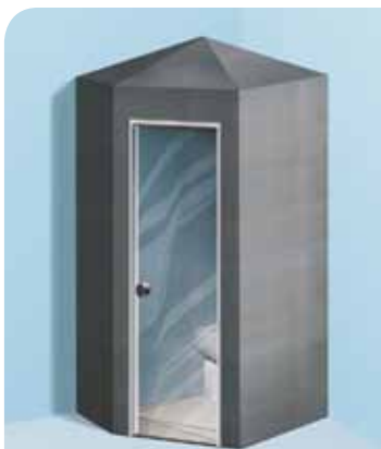
Sanoasa Toretta, avec toit en pointe