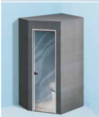
Sanoasa Toretta, avec toit plat