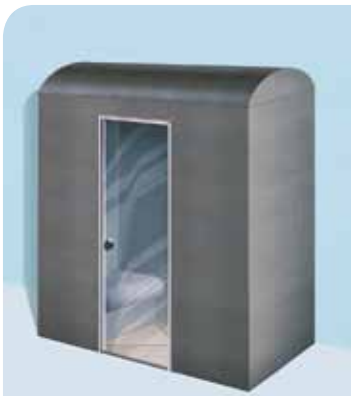
Sanoasa Pergola, con techo en túnel