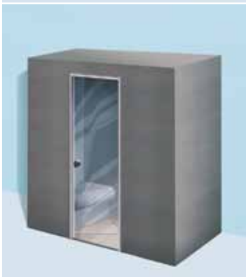
Sanoasa Pergola, con techo plano