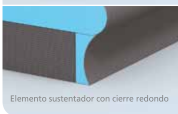
Elemento sustentador con cierre redondo