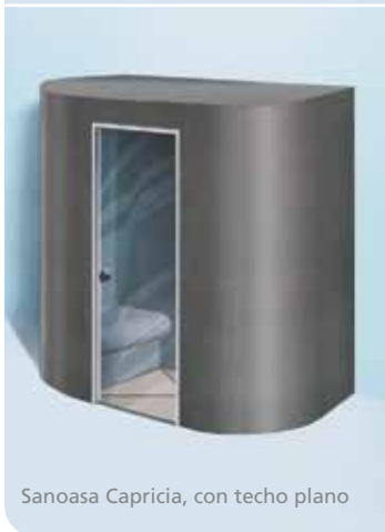
Sanoasa Capricia, con techo plano