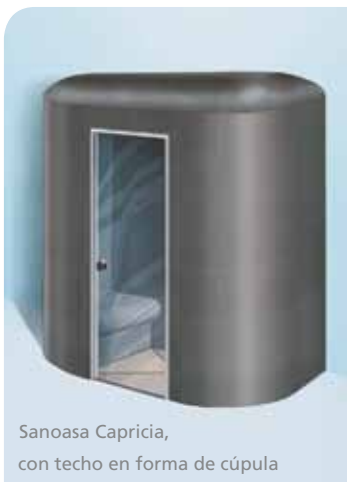
Sanoasa Capricia, con techo en forma de cúpula