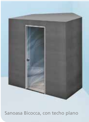
Sanoasa Bicocca, con techo plano