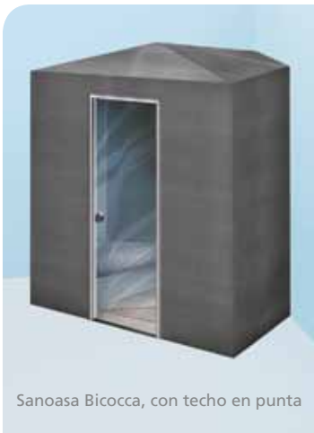
Sanoasa Bicocca, con techo en punta