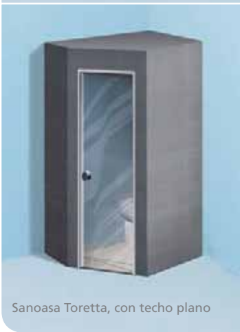
Sanoasa Toretta, con techo plano