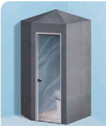
Sanoasa Toretta, con techo en punta