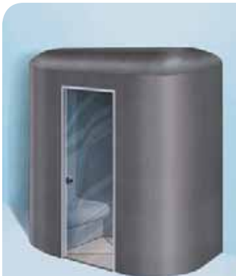
Sanoasa Capricia, con techo en forma de cúpula