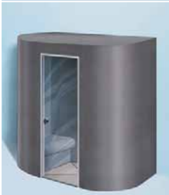
Sanoasa Capricia, con techo plano