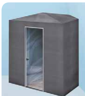
Sanoasa Bicocca, con techo en punta