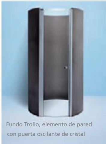
Fundo Trollo, elemento de pared con puerta oscilante de cristal