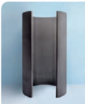
Fundo Trollo, elemento de pared