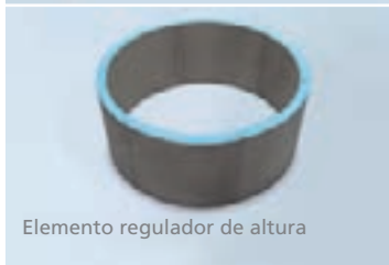
Elemento regulador de altura