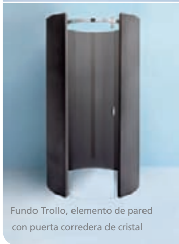
Fundo Trollo, elemento de pared con puerta corredera de cristal