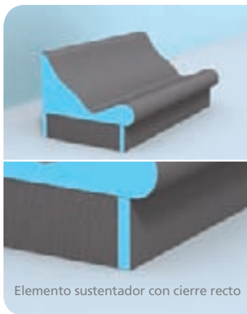
Elemento sustentador con cierre recto