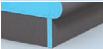
Elemento sustentador con cierre recto