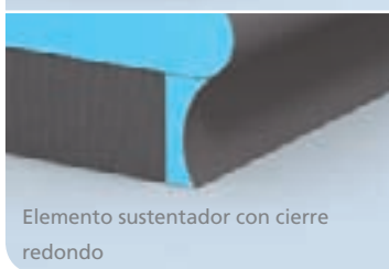
Elemento sustentador con cierre redondo